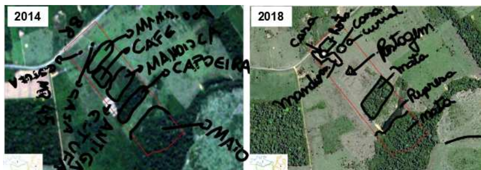
Figura 2. Evolução do uso e ocupação autodeclarado entre 2014 e 2018

preservada dentro do lote. A Figura 4.3 ilustra um caso de evolução, onde é possível verificar o deslocamento da área dedicada ao cultivo de mandioca, que em 2018 substituiu a área dedicada ao cultivo café, e o avanço da área de pastagem.