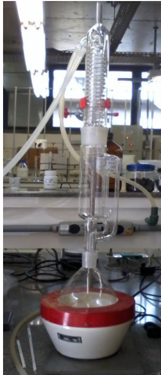
Figura 5: Extrator Soxhlet.