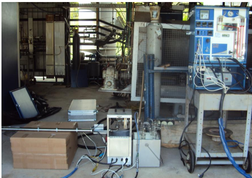
Figura 1: Coletor Isocinético de Poluentes Atmosféricos (CIPA) ISOTEC TE-750.

Dessa forma, para a amostragem do alcatrão nesse trabalho foi utilizado um Coletor Isocinético de Poluentes Atmosféricos (CIPA) ISOTEC TE-750, o qual pode ser visualizado na Figura 1. Algumas adaptações foram efetuadas visando seguir as orientações do relatório técnico e da especificação técnica para amostragem e análise de alcatrão e particulados no gás de biomassa, elaborada pelo Comitê Europeu de Padronização (“Comitê Europeu de Normalisation – CEN”). O equipamento consiste de uma sonda isocinética aquecida, um filtro de particulados aquecido, uma série de borbulhadores “impingers” e um equipamento para medida e controle de temperatura, pressão e vazão.