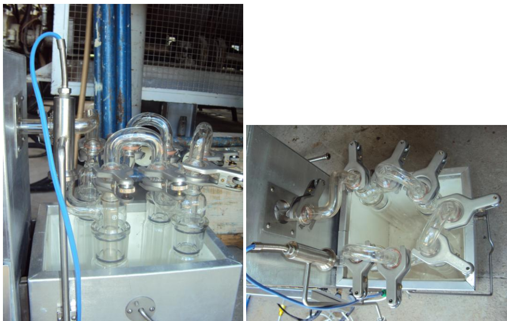
Figura 4: Borbulhadores “impingers”.

Quando todo o dispositivo já tiver sido montado e ligado na chave geral deve-se verificar se há vazamento nos sistemas de borbulhadores e no tubo pitot. Em seguida, deve-se fixar na caixa de comando as temperaturas desejadas da caixa quente e da sonda. Por fim, fazer as anotações de tempo em tempo de acordo com o número de pontos de amostragem estabelecidos, dentro de um tempo total de amostragem de 60 minutos.