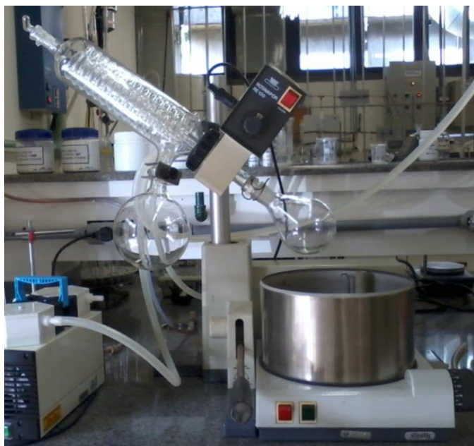
Figura 6: Rotavapor.