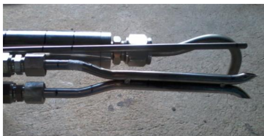
Figura 2: Extremidade da sonda.

A sonda isocinética, Figura 2, é um dispositivo em aço inox onde em sua extremidade recebe a ponteira adequada para captação dos gases e particulados, sendo a mesma introduzida no duto da chaminé. Esse equipamento pode operar na temperatura de trabalho compreendida entre 150 e 250 °C.