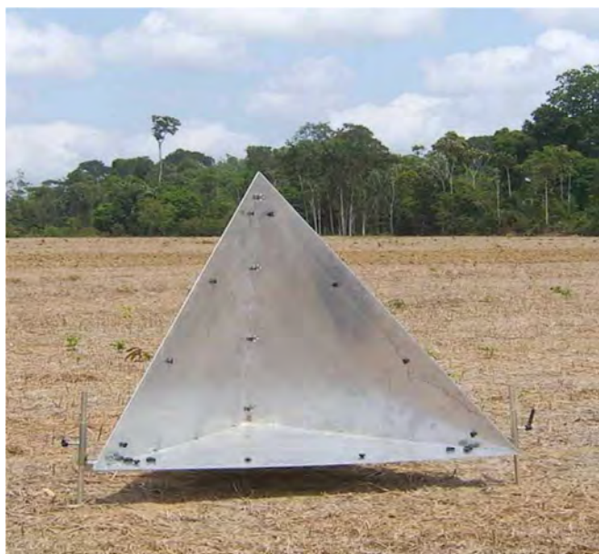
Figura 3.1 – Refletor de canto.

foram selecionados conforme o critério de qualidade baseado na imagem de coerência obtida durante o cálculo da fase interferométrica (BAMLER, 1998). Os pontos foram selecionados com valores de coerência superior a 0,7.