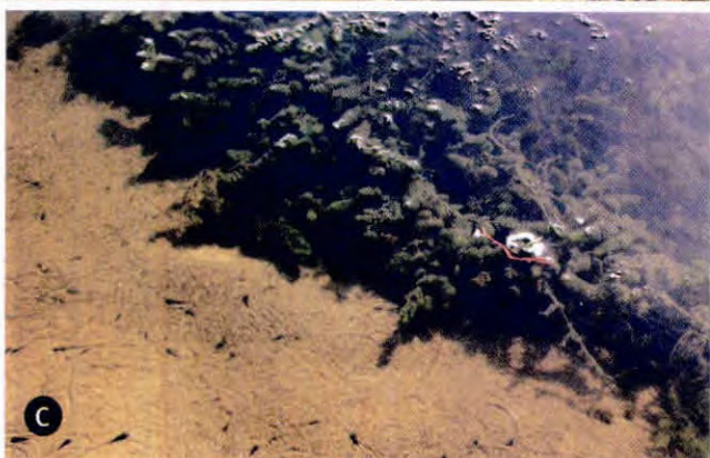
Entrada de matéria orgânica particulada (A) de origem terrestre durante o período de chuvas e crescimento de plantas aquáticas dos gêneros Ludwigia (B) e Ceratophyllum (C) em áreas do rio Seridó, na localidade Poço dos Patos

fluencie na formação de moléculas, a massa atômica terá um efeito nas reações físicas e químicas que ocorrem na natureza e nas células dos organismos. Podemos dizer que, em geral, os isótopos mais leves reagem mais rapidamente que os mais pesados. Portanto, as reações químicas que ocorrem no interior de um organismo alteram a razão entre os isótopos encontrada no alimento, gerando uma razão diferente nos tecidos desse organismo. Essa mudança na abundância relativa dos isótopos é conhecida como fracionamento isotópico.