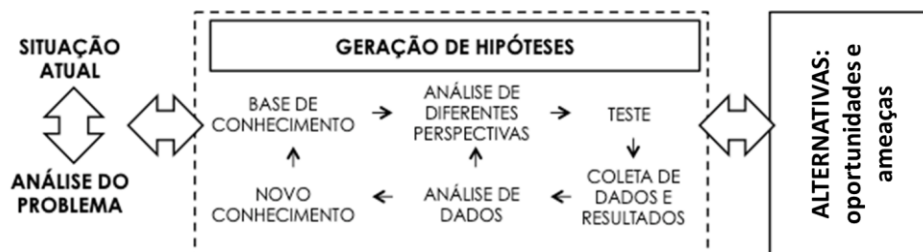
Figura 4. Geração e teste de hipóteses.

Nas etapas 3 e 4 (Figura 4) o conceito do sistema começa a ser definido com a geração e teste de hipóteses, que permite a exploração sistêmica do ambiente.