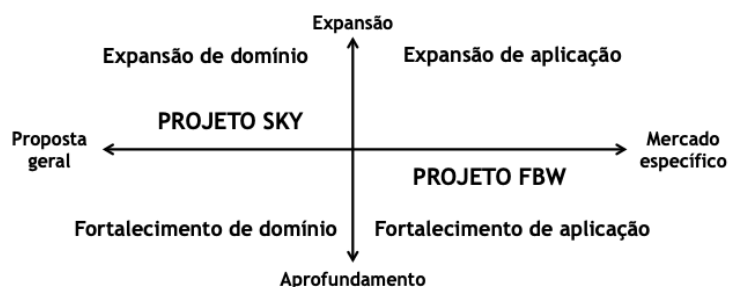
Figura 1. Mapa das escolhas críticas para capacidades dinâmicas. [Fonte: adaptado de Pisano, 2016]

Os casos também foram analisados em relação ao mapa das escolhas críticas para o desenvolvimento de capacidades dinâmicas (Figura 1), conforme definição de Pisano (2016). Diferentes níveis de incertezas na construção da estratégia tecnológica exigem investimentos em combinações de capacidades dinâmicas.