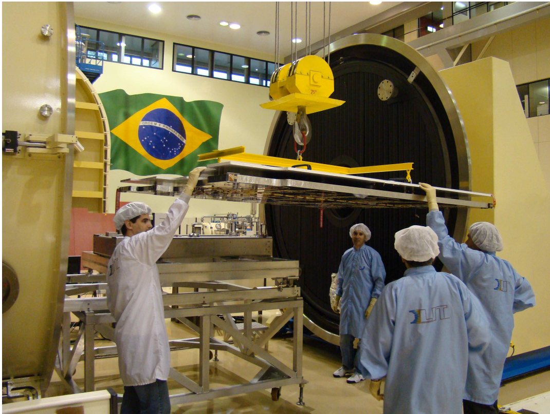
Figura 3 Teste vácuo-térmico no painel solar do satélite SAC-D/Aquarius

Do fim de maio até meados de junho, foi feito um acompanhamento nos testes vácuo-térmicos do modelo de voo dos painéis solares do satélite SAC-D/Aquarius, onde foram feitas inspeções visuais periódicas diversas, operação da própria câmara vácuo-térmica. Isso se fez necessário tendo em vista que o aparato será utilizado em testes deste tipo, simulando um eclipse da terra com o Sol enquanto o satélite se encontra em órbita, onde há formação de um gradiente de temperatura enorme no espécime.