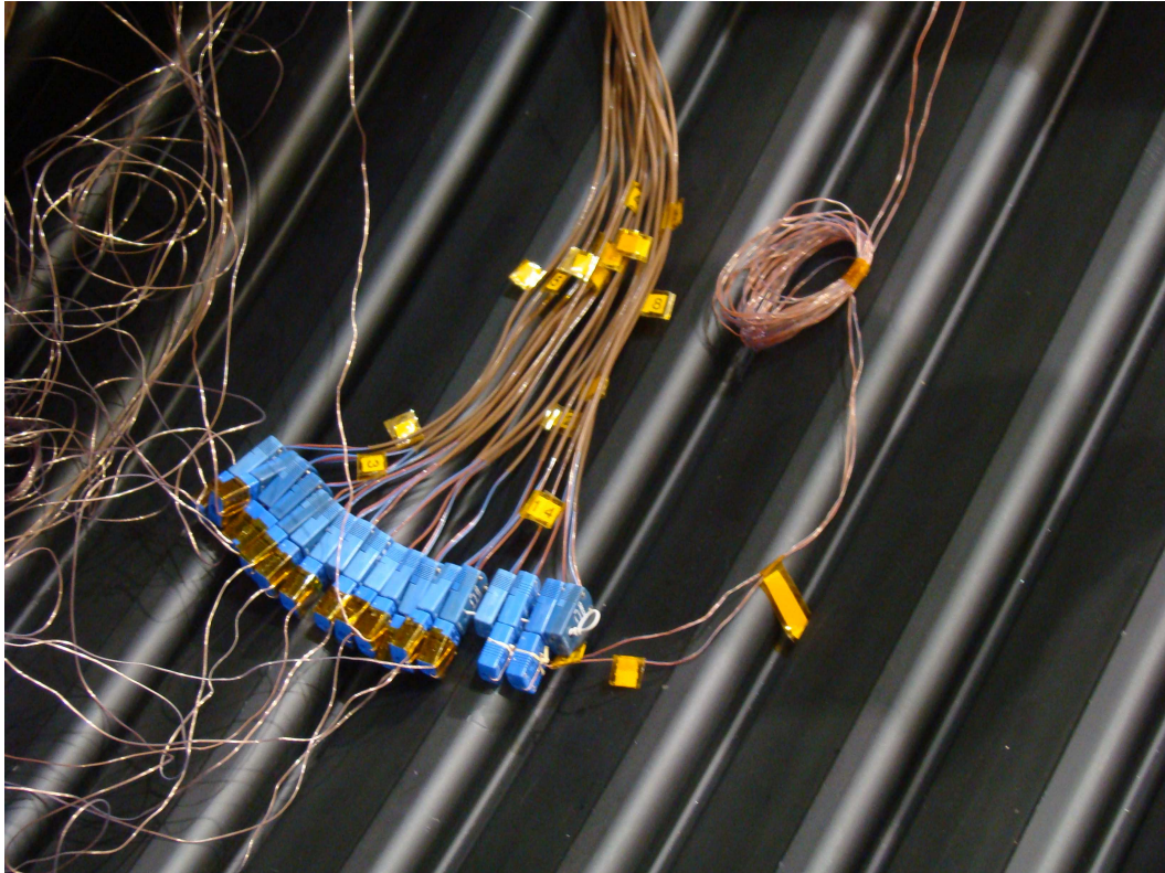
Figura 2 Termopares na câmara 3x3 a serem instalados no painel solar

Antes do laboratório abrigar os testes do modelo de vôo dos painéis solares do satélite SAC-D/Aquarius, foram feitos novos termopares para os testes e também feito um mapeamento dos termopares já existentes na câmara vácuo térmica onde os painéis seriam testados. Após o mapeamento, os termopares foram retificados e inspecionados novamente.