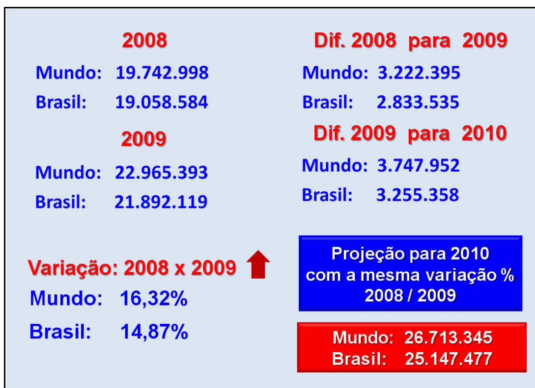
Figura 2. Número de acessos aos serviços e produtos meteorológicos do CPTEC/INPE nos anos de 2008/2009, variação e projeção de crescimento para o ano de 2010

Estes dados permitem concluir que a variação crescente em relação aos acessos originados em várias partes do mundo deve-se ao fato de que o centro de pesquisa vem ganhando espaço internacional devido ao reconhecimento de suas atividades científicas. Utilizando tais variações percentuais de crescimento, projeta-se que, até o final de 2010, o CPTEC/INPE deverá receber 26.713.345 acessos com origem em 173 Países ou mais, e 25.147.477, no Brasil.